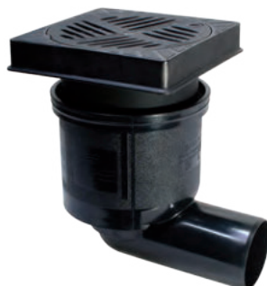
Rys.: nr art. 67 923B