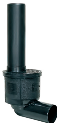
Rys.: nr art. 67 945