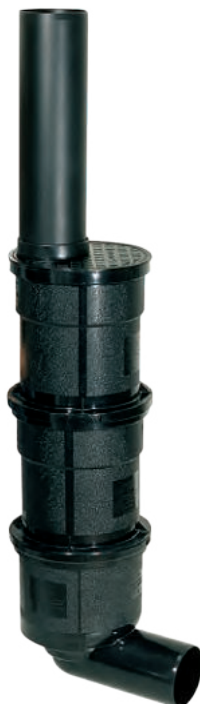
Rys.: nr art. 67 970