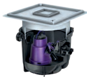
Rys.: nr art. 280570X

Uwaga: produkt zastępuje przepompownię o nr art. 28570