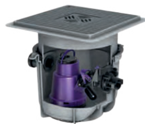
Rys.: nr art. 280570S