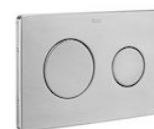
PL10 ONE - Przycisk podwójny wandaloodporny inox