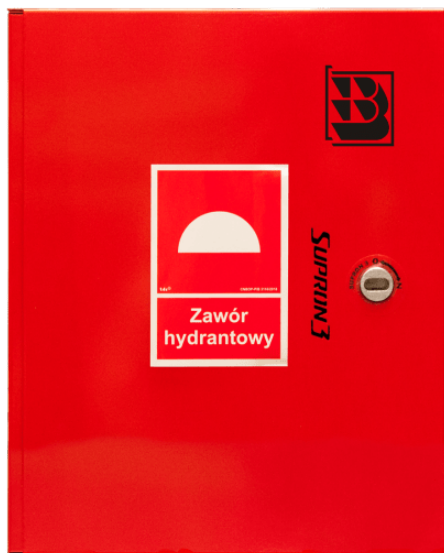
ZH-52 w obudowie >>