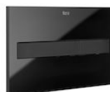
PL7 ONE -Przycisk podwójny szkło tworzywo