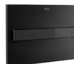
PL7 ONE -Przycisk podwójny matowy