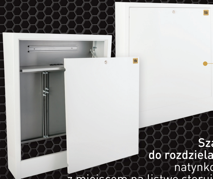
Szafki do rozdzielaczy natynkowe z miejscem na listwę sterującą