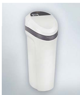
Stacja uzdatniania wody Aquahome Duo