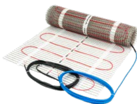
Mata grzejna DEVIheat™ 150S