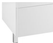
Zestaw 2 nóg