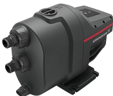
Grundfos SCALA1 – pompa pojedyncza

Jeżeli potrzebna jest większa wydajność, to można ją łatwo uzyskać przez połączenie dwóch pomp. Taki zestaw konfiguruje się za pomocą aplikacji Grundfos GO REMOTE.