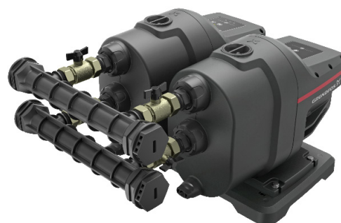
Grundfos SCALA1 – zestaw dwupompowy