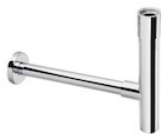
Ozdobny syfon umywalkowy